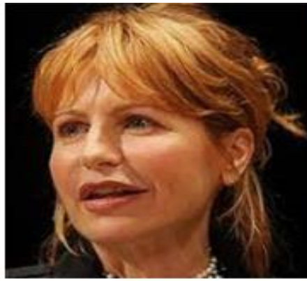
Lilli Gruber from A. Adige: television reporter