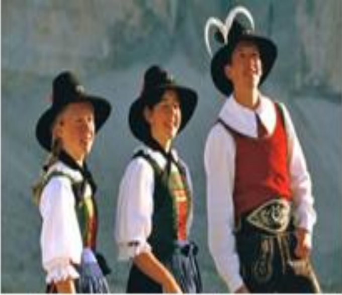
Traditional Alto Adige dresses