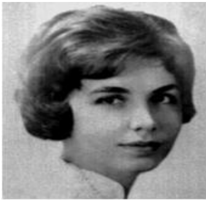
Grazia Deledda from Sardinia: 1926, Nobel prize- Literature