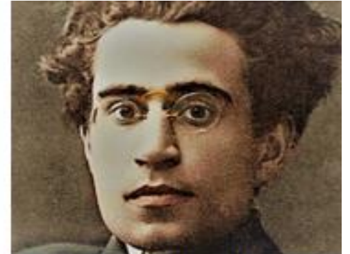
Antonio Gramsci: Sardinian and Arbresh ; political scientist