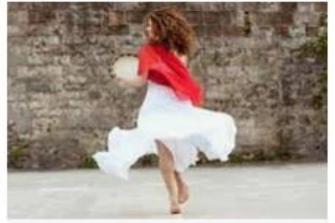
Taranta Dance : from Salento