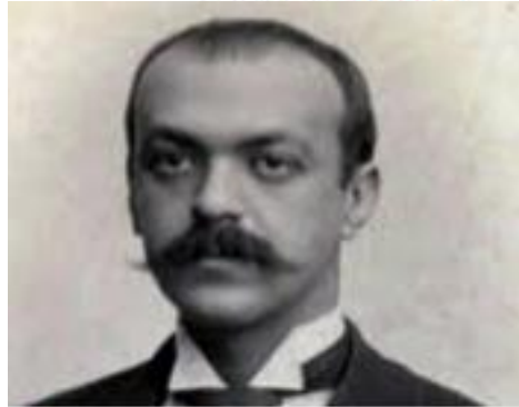
Italo Svevo from Friuli V. Giulia: a leading novelist