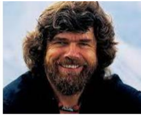
Reinhold Messner from A. Adige: mountain climber