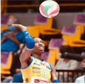
Paola Egonu: captain of National Volley team from Nigeria

Sadece spor değil, aynı zamanda sanat ve siyaset