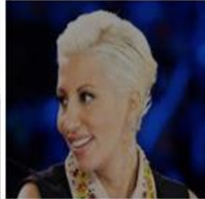
Malika Ayane, singer from Morocco