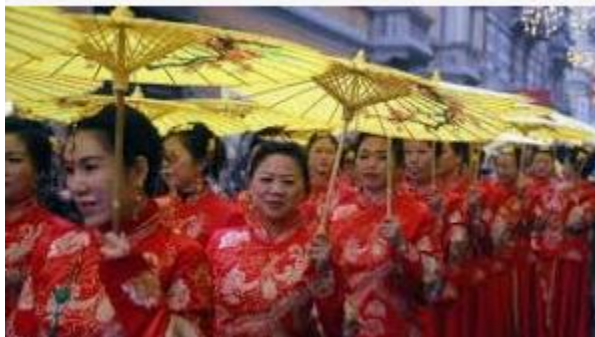
Foto 2. Femei costumate pentru Anul Nou Chinezesc

Doar 402 persoane s-au înscris în 1975 care desfășoară activități itinerante, restaurant și spălătorie. Fluxul real începe din anii 80 până în anii 2000, datorită liberalizării adoptate în țara de origine care depopulează mediul rural și creează tensiuni puternice pe piața muncii. Bazându-se pe familiile deja prezente în Italia, noii veniți își extind și perfecționează afacerea de restaurante, se stabilesc în sectoarele import-export, textile și marochinărie și, mai ales, creează un nou mod dinamic de afaceri, tot datorită unui tânăr foarte tânăr și componenta demografică educată. Astăzi, sunt puțin sub 300.000. Actuala a treia generație de italo-chinezi are o diplomă și sunt pe deplin integrate și asemănătoare cu colegii lor italieni, cu care împărtășesc gusturi și comportamente. Prin urmare, succesul chinez nu este doar economic, ci și relațional. Nașterea cartierelor chinezești în marile orașe, departe de a fi o ancoră în trecut, sunt puntea relațională între tradiții și evenimente actuale, între folclor și interculturalitate.