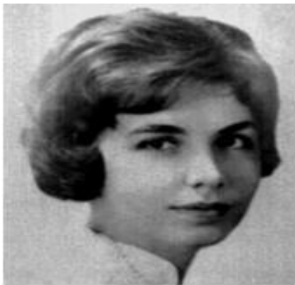
Grazia Deledda from Sardinia: 1926, Nobel prize- Literature