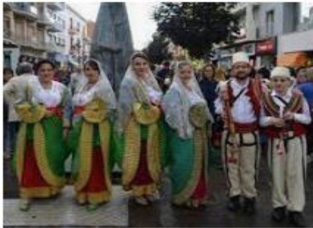
A party in Piana degli Albanesi (Sicily)