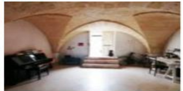
Interior of a traditional house in Salento