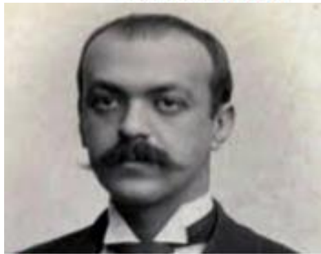
Italo Svevo from Friuli V. Giulia: a leading novelist