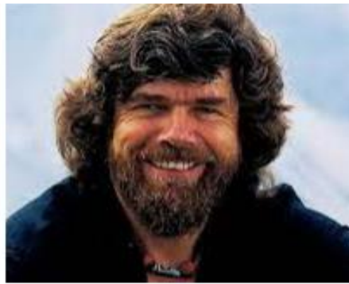
Reinhold Messner from A. Adige: mountain climber