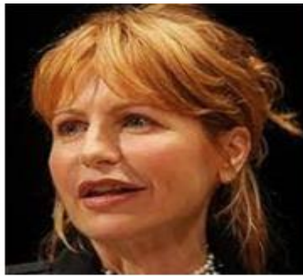
Lilli Gruber from A. Adige: television reporter