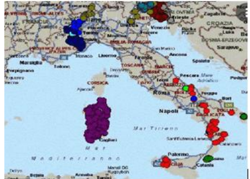
Harta răspândirii minorităților istorice

Italia a fost întotdeauna un mozaic de popoare, asimilate treptat. Cele 12 grupuri etno-lingvistice actuale (în total, aproximativ 300 de mii de persoane) beneficiază de legi care protejează bilingvismul, obiceiurile și riturile. Unele zone au autonomie administrativă locală/regională (Valle d'Aosta, Trentino A. Adige, Friuli V. Giulia, Sicilia, Sardinia). Membrii lor au fost întotdeauna cetățeni activi, prezenți în toate fațetele diferite: de la muncă la artă, de la politică la administrarea afacerilor publice etc.