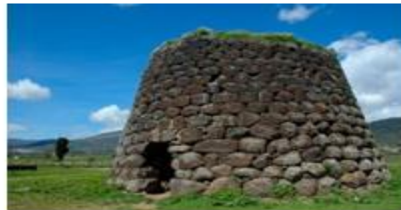
Sardinian Symbols: the Nuraghes , Prehistoric fortress-houses