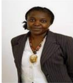
Cécile Keingé: former Minister (2013) from Congo