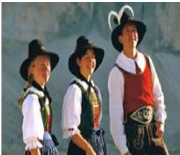
Traditional Alto Adige dresses