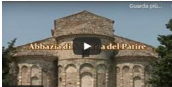
Municipality of Rossano Calabro ( comune di rossano - YouTube)