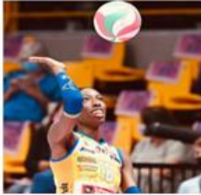
Paola Egonu: captain of National Volley team from Nigeria

Nu doar în sport, ci și în artă, politică