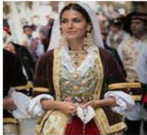
Traditional Sardinian dress