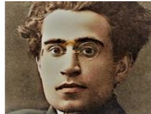
Antonio Gramsci: Sardinian and Arbresh; political scientist