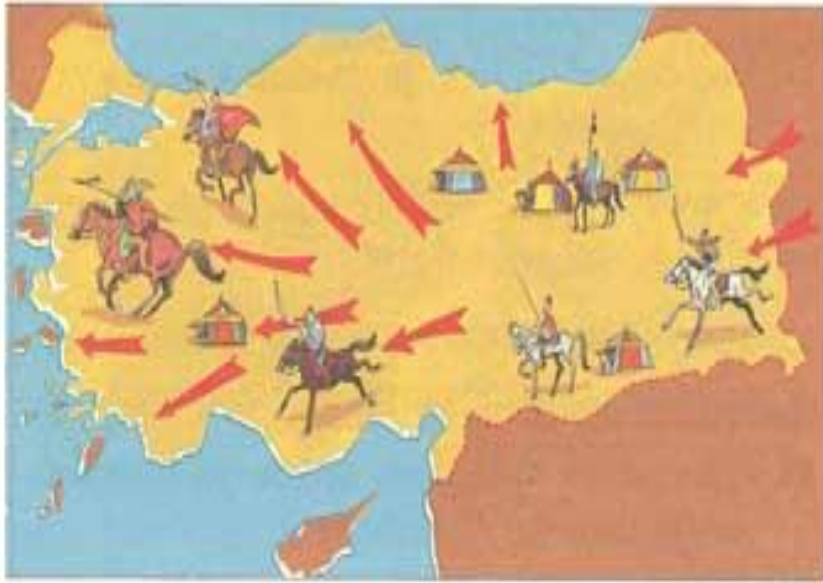
Türklerin Anadolu'yu fethini gösteren temsili resim.