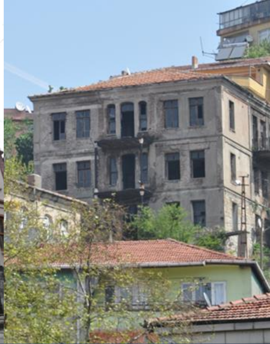
Casă Franțizească renovată din Zonguldak.