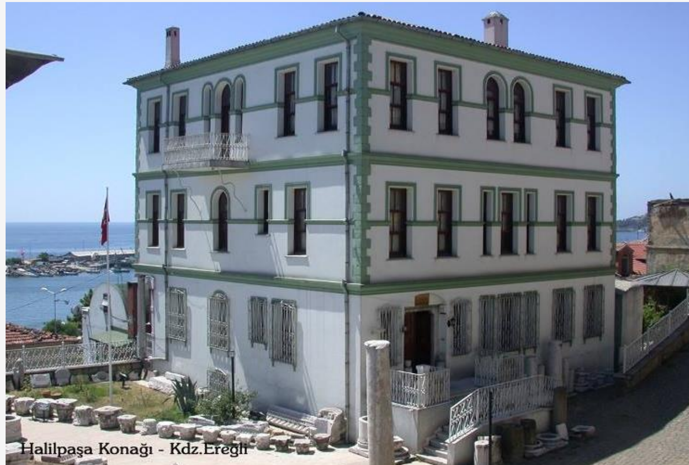
Halilpaşa Konağı - Kdz.Ereğli

Casa Halil Pasha din Provincia Ereğli a Zonguldak, din timpul Imperiului Otoman. Această clădire este acum muzeu.